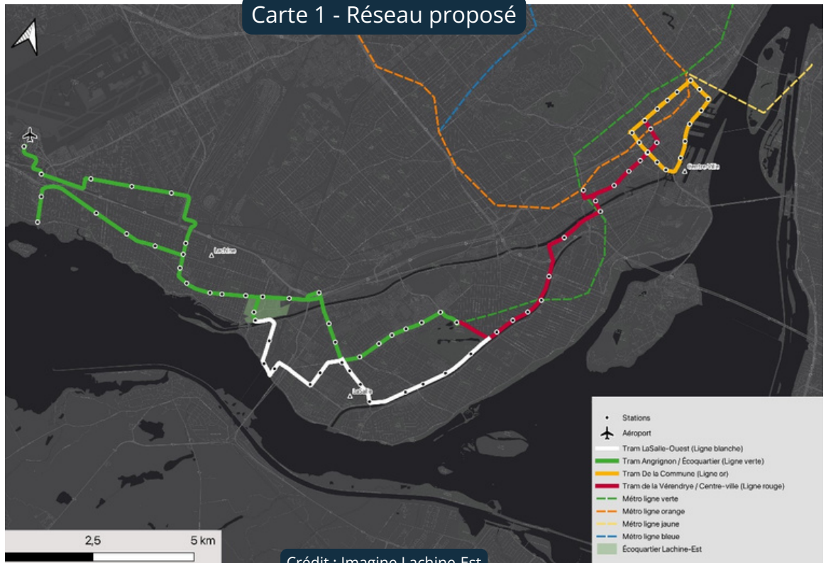
Carte 1 - Réseau proposé

L'extension de métro envisagée pour 6 stations sur 8,5 km coûterait environ 9 G$. Pour des budgets similaires, le Grand Sud-Ouest pourra se doter, en une dizaine d'années, d'un vaste réseau de tramways de près de 50 km pour 4 lignes et près de 70 stations.