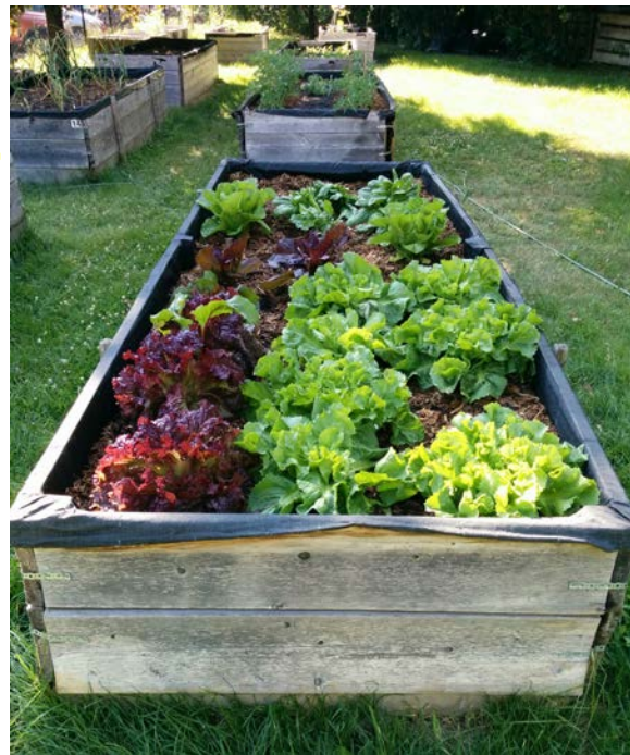
Jardin en bacs

Des jardins au sol et en bac adaptés pour les personnes à mobilité réduite pourraient être aménagés de part et d'autre du verger. L'installation d'une serre comme lieu d'animation pourrait bonifier l'offre d'opportunité éducative. Une culture de houblon, en plus de délimiter les espaces, pourrait s'inscrire dans la révolution brassicole montréalaise.