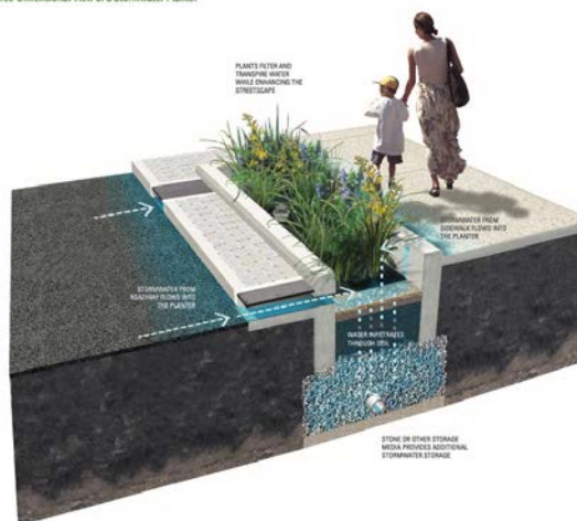
Figure 2.1: Three-Dimensional View of a Stormwater Planter

La préservation du patrimoine vert et les efforts pour éviter la création d’îlots de chaleur urbains, l’arrivée éventuelle des vélos et voitures en auto partage et en libre-service et des voitures autonomes à moyen ou long terme demandent une réflexion sur le stationnement. Il serait peut-être intéressant d’évaluer la possibilité que l’aménagement des nouvelles aires de stationnement puisse tendre vers une accréditation Stationnement écoresponsable nouvellement créée par le Conseil Régional de l’environnement de Montréal (CRE-Mtl) 4 .